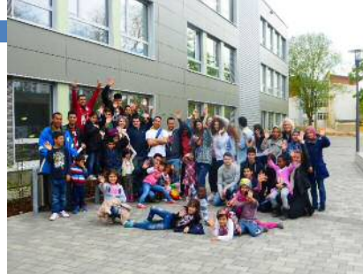
unser ehemaliges Willkommenscafé