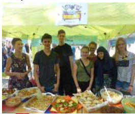
interkulturelles Buffet beim Sommerfest 2016